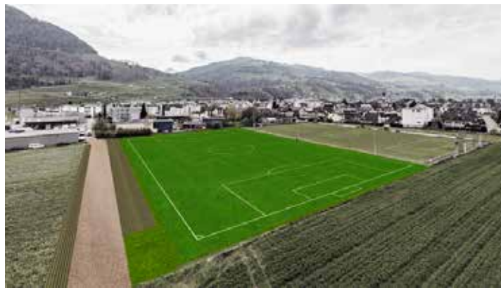
Ist-Zustand (links) und Visualisierung des projektierten Allwetterplatzes.

Einen besonderen Stellenwert nimmt die Nachwuchsförderung ein. In dieser wird nicht nur der Fussballsport betrieben und gefördert, es werden auch Werte wie Pünktlichkeit, Fair-play, Respekt und Toleranz vermittelt.